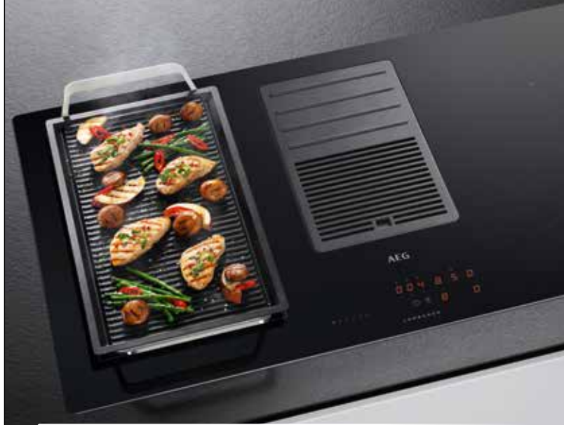
KOCHFELD-DUNSTABZUG-KOMBINATION - UMLUFTVERSION